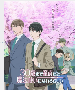
แอนิเมชัน