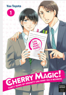
มังงะต้นฉบับ

คำว่า ‘วาย’ มาจากการ์ตูนญี่ปุ่นประเภทยาโออิ (Yaoi) ที่เล่าเรื่องราวความสัมพันธ์ระหว่างชายและชาย และยูริ (Yuri) ซึ่งแสดงถึงความรักระหว่างหญิงและหญิง ซึ่งได้รับความนิยมในกลุ่มนักอ่านมาอย่างต่อเนื่อง มีกลุ่มผู้ติดตามที่สนใจอย่างเหนียวแน่นและขยายวงมากขึ้นอย่างรวดเร็ว ทำให้เรื่องราวในตัวตนสื่อถูกดัดแปลงเป็นการ์ตูนแอนิเมชัน ละคร ภาพยนตร์ซีรีส์ และสื่อบันเทิงอื่น จนถึงปัจจุบันท่ามกลางกระแสการเปิดกว้างที่มีมากขึ้นทั่วโลก ประเทศไทยมีการยอมรับความเท่าเทียมทั้งด้านกฎหมายและสังคม จึงมีการผลิตซีรีส์วายเพิ่มขึ้น พร้อมกับสร้างสรรค์ทั้งด้านเนื้อหาและเทคนิคการนำเสนอจนได้รับความนิยม ส่งผลให้ธุรกิจซีรีส์วายเติบโตแบบก้าวกระโดด อีกทั้งของยังมีแนวโน้มขยายตัวไปในระดับโลกได้ไกลกว่าเดิม