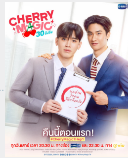
ซีรีส์ (ไทย)