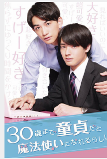
ซีรีส์ (ญี่ปุ่น)